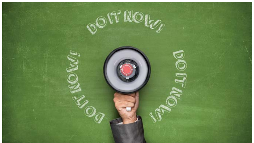
Die Krux beim Changemanagement: Wie bringt man die Leute dazu Veränderungen umzusetzen?